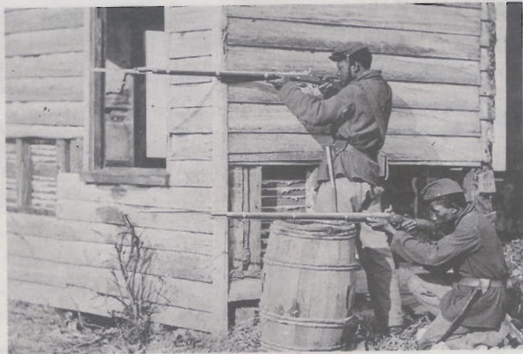
Svarte i kamp: 175 000 svarte sloss på unionens side, og har sin viktige del av den militære seieren. Mot slutten var sørstatene så desperate at de foreslo at svarte skulle settes til å slåss for å bevare slaveriet.